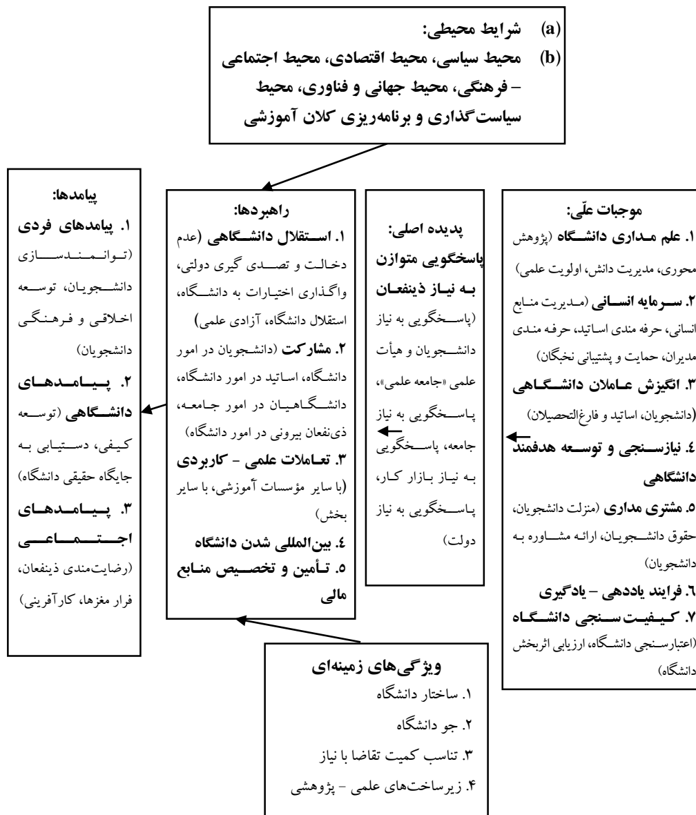
شکل ۱. الگوی پارادایمی پاسخگویی دانشگاه‌های دولتی

لذا بر اساس بیان روایتی مؤلفه‌های به‌دست‌آمده طی پارادایم کدگذاری محوری و انتخابی و روابط بین آن‌ها را می‌توان در قالب قضایای ۱ زیر خلاصه نمود: