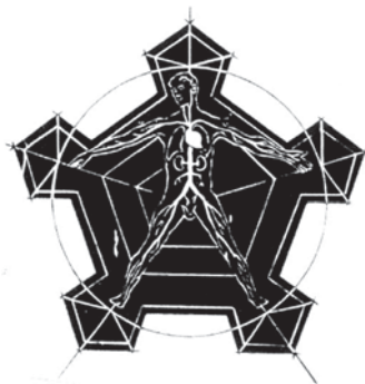
شکل ۱. نمونه‌ای از شهر رنسانسی در اروپا