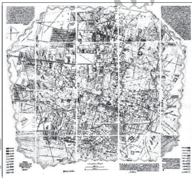
شکل ۲. نقشه تهران ناصری

در کنار عوامل بیرونی پیرامون رشد شهر و تغییرات کالبدی تهران می‌توان به عواملی همچون افزایش جمعیت تهران و احداث قصرهای سلطنتی، کوشک‌های اعیانی و سفارتخانه‌ها و منازل خارجی‌ان در بیرون حصار و رشد محله‌های جدید پیرامون بارو نیز اشاره نمود (سعیدنیا،