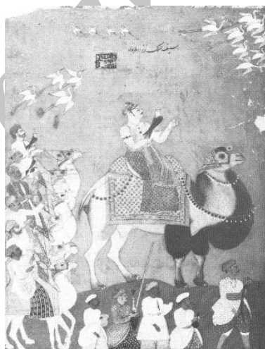
تصویر شماره ۹. نواب اعتصام الملک بهادر

نواب اعتصام الملک بهادر در یک نقاشی سوار بر فیل با جقه نشان داده شده است. تاریخ این نقاشی ۱۷۹۵ میلادی است. (زبروفسکی، ۱۹۸۳: ۲۲۶)