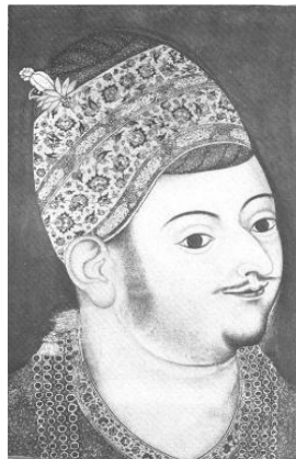
تصویر شماره ۲. سلطان ابراهیم عادلشاه از شاهان شیعه دکن

در نقشی از ابراهیم عادلشاه از شاهان شیعه دکن هندوستان بر کلاه ترمه او نقش بُته مشاهده می‌شود. ترمه به دلیل ظرافت در ساخت کلاه نیز مورد استفاده بوده است. این نقاشی متعلق به سال ۱۵۹۵ میلادی است (تصویر شماره ۲) (Zebrowski:1983:74)