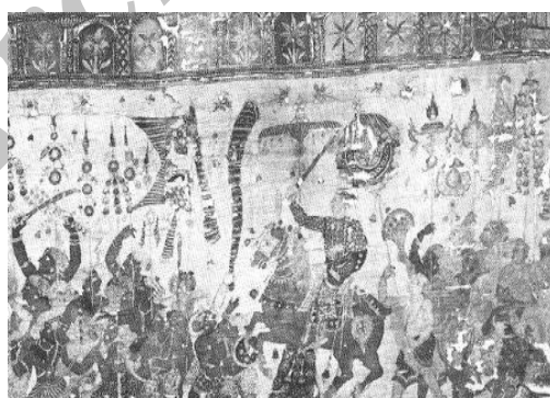
تصویر شماره ۵. کریشنا ایزد هندی

کریشنا ایزد هندی بر فرش نشسته که نقش بُته دارد، ایستاده است. تاریخ این نقاشی سال ۱۶۵۰ میلادی است. (زبروفسکی، ۱۹۸۳: ۲۰۳)