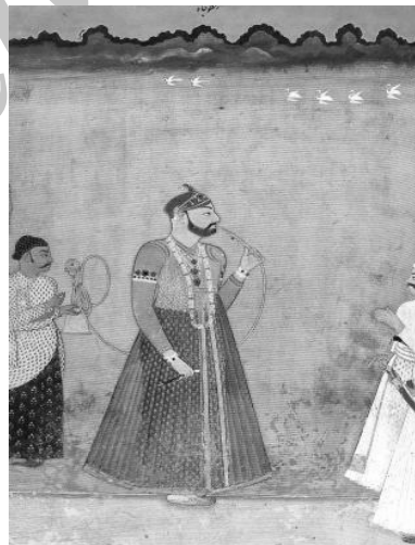
تصویر شماره ۱۱. منیرالملک ملقب به ارسطوجاه

منیرالملک ملقب به ارسطوجاه با جقه نشان داده شده است. تاریخ نقاشی ۱۸۱۰ میلادی حیدرآباد هندوستان است. (زبروفسکی، ۱۹۸۳: ۲۴۸)