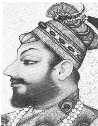
تصویر شماره ۸. علی عادلشاه

در تصویری علی عادلشاه با جقه نشان داده شده است. (زبروفسکی، ۱۹۸۳: ۱۷۶)