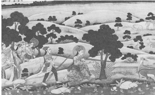
تصویر شماره ۱۰. شاهزاده‌ای در حال شکار

شاهزاده‌ای که شکار می‌کند با جقه نشان داده شده است. مربوط به قرن هجدهم میلادی موزه حیدرآباد هندوستان. (زبروفسکی، ۱۹۸۳: ۲۵۷)