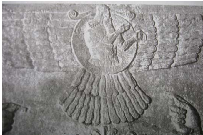
تصویر شماره ۱. ماد آشور خدای آشوریان، عراق موزه بریتانیا، قرن ۷ قبل از میلاد

در فرهنگ آستیک ۱ هندو که خدا محور است، از دایره‌ای به نام ماندالا ۲ سخن به میان می‌آید که مربعی را در دل خود دارد. مربع به مفهوم جهان مادی است و اینکه شاهان خود را سلطان چهارگوشه جهان می‌نامند، به مفهوم سلطه بلامنازع آنهاست. این دایره گاه با بال نمایش داده می‌شود که مفهوم فلسفی سلطه مطلق از آن استنباط می‌شود. بنا به اعتقاد فرقه تانتری ۳ که خود از شعب بودایی‌گری است، منشأ دایره را باید در اعتقادات بوداییان جست‌وجو کرد (جمیز هال، ۱۳۸۰: ۱۶). بعدها بوداییان بر مبنای دایره یا چرخ به دوشعبه ماهایانا ۴ و هینایانا ۵ تقسیم شدند که به مفهوم دایره‌های بزرگ و کوچک است. دایره در اعتقاد هنود و بوداییان به معنای تمرکز است. اما مفهوم دیگری که می‌توان از آن استنباط کرد، شاخ است که به نوبه خود به مفهوم اقتدار است و قدرت مطلق و چنین است که چهره‌های نامدار تاریخی یا پیش از تاریخی را با شاخ نشان می‌دادند. در نمونه‌های مذهبی شیوا و در نمونه‌های اسطوره‌ای رستم و در نمونه‌های تاریخی کوروش قابل ذکر است که به دلیل داشتن شاخ، لقب ذوالقرنین یا صاحب دوشاخ گرفته است.