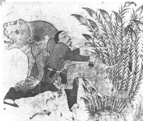
تصویر شماره ۳. مردی که شیری را می‌کشد

در نقاشی مردی که شیری را می‌کشد، بُته مشاهده می‌شود. عصر ارائه این اثر احتمالاً اواسط قرن شانزدهم میلادی است (تصویر شماره ۳). (Zebrowski:1983:101)