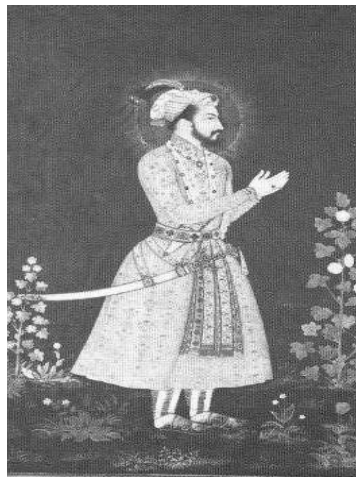
تصویر شماره ۷. شاه جهان

در تابلویی که در موزه ملکه ویکتوریا لندن قرار دارد. شاه جهان را با جقه نشان داده شده است. تاریخ اجرای این نقاشی قرن هفدهم است. (زبروفسکی، ۱۹۸۳: ۱۲۵)