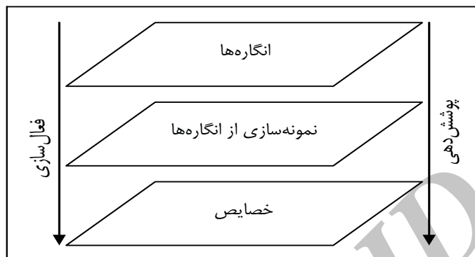
شکل شماره ۲. فرایند به‌کارگیری انگاره‌ها در ذهن انسان