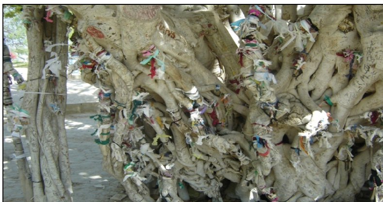
تصویر شماره ۱. مقدس بودن درخت انجیر معابد به عنوان بخشی از اعتقادات مردم.

سبک زندگی، اعتقاداتها و ارزش‌های متفاوت این افراد بالطبع موجب ایجاد کنش‌های فرهنگی با بومیان خواهد شد (طرح جامع مدیریت سواحل و محیط زیست جزیره کیش، ۱۳۸۶: ۵۶).