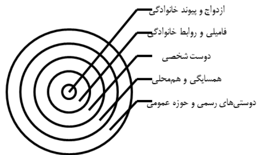
شکل شماره (۱). مرزبندی و تردهای فرهنگی در سطوح مختلف

بنابراین، می‌توان نتیجه گرفت که مرزهای فرهنگی در سطح ازدواج، روابط خانوادگی، و دوستی میان دو طرف طیف (متشرع و غیرمتشرع) شدید است، اما در سطح دوستی، از شدت این مرزبندی برای کسانی که در میانه طیف قرار دارند، کاسته می‌شود و امکان تردد فرهنگی، افزایش می‌یابد. این تردد در حوزه عمومی و رسمی، بیشتر مشهود است.