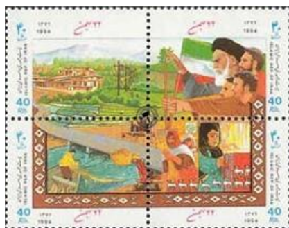
تصویر شماره (۲). تمبر چاپ‌شده در دهه ۱۳۷۰ به مناسبت سالگرد انقلاب اسلامی

بررسی نمادها و نشانه‌های مربوط به دهه ۱۳۶۰، تمایل جمهوری اسلامی ایران به درج نمادها و شمایل انقلابی را نشان می‌داد. آنچه در دهه ۱۳۷۰ اهمیت دارد، کاهش نمادها و شمایل انقلابی و درج نمادها و شمایل طبیعی، آبادانی، و ورزشی است.