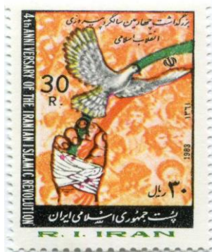
تصویر شماره (۱). تمبر چاپ شده به مناسبت سالگرد انقلاب اسلامی در دهه ۱۳۶۰