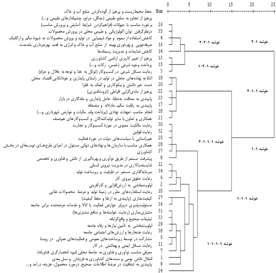
شکل ۱. نتیجه تحلیل خوشه‌ای سلسله‌مراتبی

خوشه ۱-۱-۱ در فاصله ۷، به دو خوشه ۲-۱-۱-۱ و ۱-۱-۱-۱ تقسیم شد. در این بین، تفاوت عامل‌های تفکیک شده بر خوشه ۲-۱-۱-۱ چندان زیاد نیست. این امر نشان‌دهنده ارزیابی تقریباً یکسان پاسخگویان از این عامل هاست. این خوشه در فاصله ۲، به دو خوشه خرد شکسته شد. یکی از این خوشه‌ها یک عامل «هم‌راستایی با سیاست‌های دولت در حوزه فعالیت» را شامل می‌شود و خوشه دیگر با تفکیک پنج عامل «انجام مناسب تعهدات نهادی (پرداخت وام، مالیات و عوارض شهرداری و...)، همکاری و تعاون با سایر تولیدکنندگان و کسب و کارهای هم‌صنف، رعایت