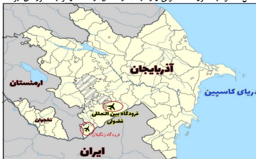
شکل ۳: موقعیت فرودگاه فضولی و زنگلان در مناطق آزادشده و نزدیک مرزهای ایران

زنگلان در سال ۲۰۲۲ کامل شد. فرودگاه لاجین نیز در بهار ۲۰۲۴ تکمیل خواهد شد (Nakanishi, 2023: 33).