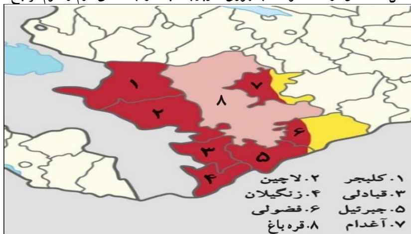
شکل ۲: مناطق آزادشده توسط جمهوری آذربایجان بعد از جنگ‌های دوم و سوم قره‌باغ

قدرت خود به دنبال بازپس‌گیری منطقه قره‌باغ برآید. به این ترتیب درگیر شدن روسیه به جنگ اوکراین به طور قابل توجهی توانایی‌های این کشور را در دیگر مناطق اصلی فضای پس از شوروی محدود کرده است. در قفقاز جنوبی، مسکو تمام تلاش خود را می‌کند تا وارد درگیری مستقیم با ترکیه و جمهوری آذربایجان نشود و داوری بی‌طرف در بحران ارمنستان و جمهوری آذربایجان باقی بماند. سیاست روسیه از نظر انرژی در جنوب قفقاز به جمهوری آذربایجان نزدیک می‌شود (Koolae and Hadipoor, 2020: 662) به طوری که روسیه برای کاهش آثار تحریم‌های غرب به جمهوری آذربایجان و بیشتر به ترکیه نیاز دارد؛ آنکارا به عموماً یک شریک تجاری اصلی برای مسکو و باکو در راه‌گذر شمال‌جنوب تأثیر می‌گذارد (Grigoryan, 2023). اما زمانی که پوتین به جنگ علیه اوکراین فکر می‌کرد، بیشتر به روابط خود با ترکیه و جمهوری آذربایجان اهمیت می‌داد تا ارمنستانی که از نظر اقتصادی فقیر و از نظر سیاسی، گرایش به غرب خود را آشکار کرده است. از این رو روسیه در جنگ قره‌باغ در سال ۲۰۲۳ به جمهوری آذربایجان اجازه داد تا قره‌باغ کوهستانی را از وجود ارمنه‌ای که به حمایت مسکو متکی بودند، پاک‌سازی کند. روسیه به دنبال اخراج ارمنه از قره‌باغ بود تا از آن برای دامن‌زدن به تغییر رژیم در ارمنستان یا به عنوان تنبیهی برای زیر فشار قراردادن پاشینیان استفاده کند (Ostrovsky, 2023).