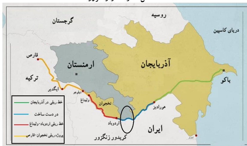
شکل ۴: راه‌گذر زنگزور

روندهای ژئوپلیتیکی در جنگ دوم قره‌باغ است که می‌تواند پیامدهای ژئوپلیتیکی نیز در آینده به‌همراه داشته باشد.