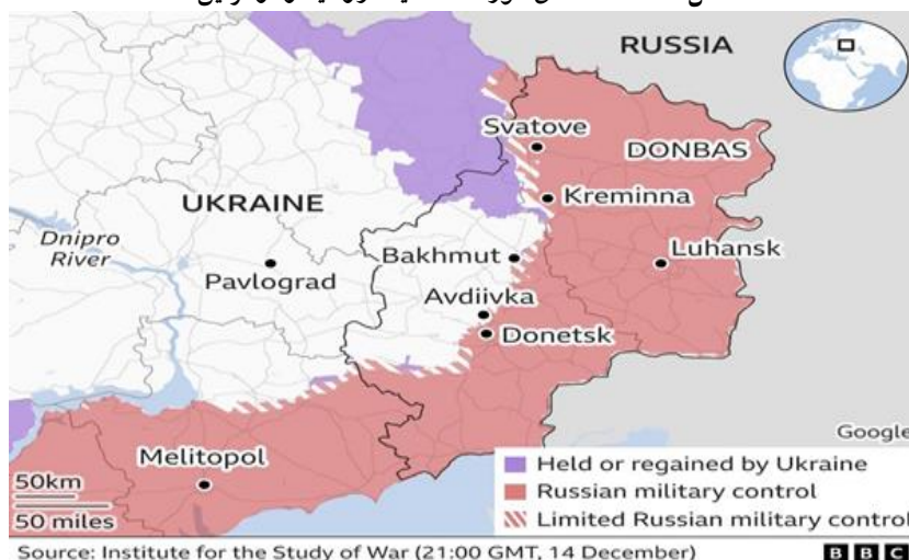
شکل ۱: نقشه مناطق مورد ادعا میان روسیه و اوکراین