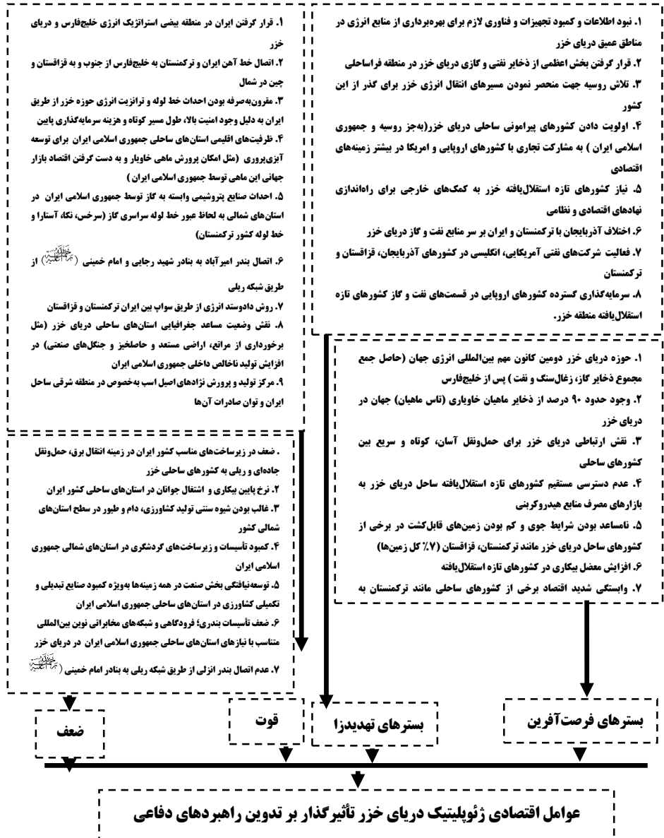
شکل ۲: مدل مفهومی