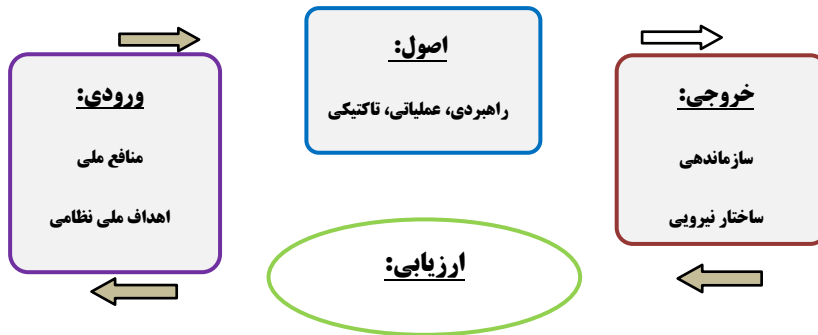
شکل ۱: فرآیند تدوین اصول نظامی نیروی زمینی آمریکا،