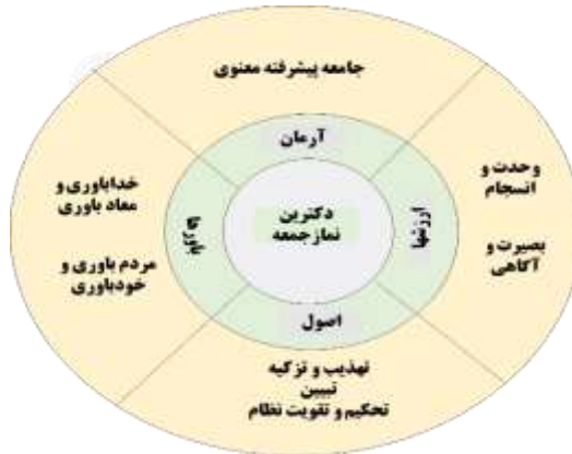
شکل ۲: مؤلفه‌ها و شاخص‌های دکترین نماز جمعه

از دیگر نتایج این تحقیق تبیین اصول، آرمان، ارزش‌ها و باورهای دکترین نماز جمعه است. اصول: «تهذیب و تزکیه»، «تبیین»، «تحکیم و تقویت نظام»، آرمان: «حرکت به سمت جامعه پیشرفته معنوی»، ارزش‌ها: «وحدت و انسجام‌بخشی»، «بصیرت و آگاهی» و باورها: «خداباوری»، «مردم باوری» مؤلفه‌ها و شاخص‌های دکترین نماز جمعه است.