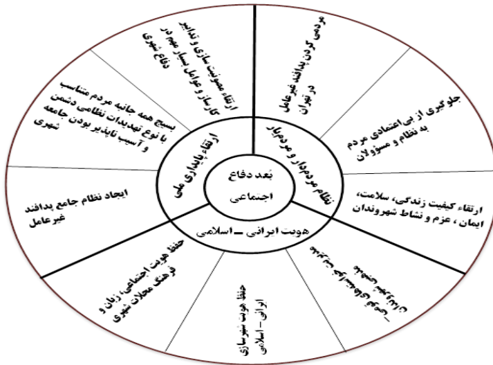
شکل ۲: الگوی نهایی تحقیق

تمامی خبرگان بعد دفاع اجتماعی و مؤلفه‌های سه‌گانه پیشنهادی را کافی و مورد تأیید قراردادند. تعدادی بیشترین اهمیت را برای این بُعد قائل بوده و تعدادی هم‌نظر به سبک‌سازی تهران و انتقال بخش‌هایی کارکردی از آن را به دیگر شهرها ارائه دادند. اکثریت خبرگان میزان اهمیت شاخص-های پیشنهادی را زیاد و خیلی زیاد نظر داده‌اند. تعدادی به ساختار مشترک پدافند غیرعامل و بحران تأکید داشتند. تعدادی مدیر یکپارچه و واحد شهری و فرمانده بحران تهران را شهردار و با عملکرد قرارگاهی پیشنهاد داشته و تعدادی فرماندهی واحد با برنامه‌ریزی متمرکز و اجرای غیرمتمرکز را پیشنهاد دارند. تعدادی با توجه به ساختارهای سیاسی و اداری کشور مدیریت واحد و فرماندهی را برای شهردار پیشنهاد نداشته و اعتقاد دارند اکنون باید وزارتخانه‌ای مانند کشور عهده‌دار این مهم باشد.