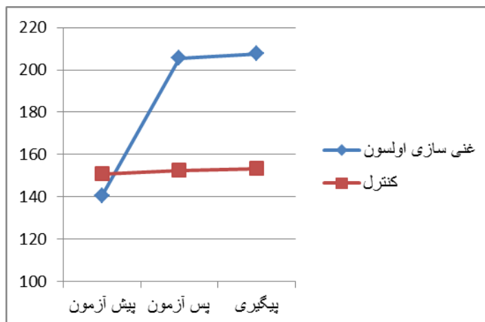
نمودار ۲. نمودار تغییرات صمیمیت زناشویی در طول زمان در مردان به تفکیک گروه

غنی‌سازی روابط زوجین با استفاده از شیوه اولسون مهارت‌هایی را آموزش می‌دهند که زوجین با به کارگیری آن‌ها می‌توانند به یک زندگی سالم و شاد دست یابند. زندگی زناشویی بدون دغدغه و شاد و همراه با صمیمیت زناشویی نیازمند یادگیری مهارت‌هایی است که شاید در خانواده هسته‌ای آموزش داده نشوند. یکی از این مهارت‌ها، مهارت حل تعارض است. بدیهی است که بین زن و مرد تفاوت‌های بسیاری به لحاظ تمایلات جنسی (۱۴)، روانشناختی (۱۵-۱۸)، جسمی (۱۹)، و