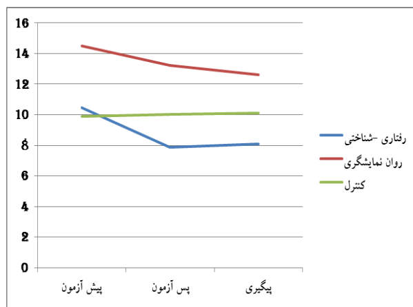
رفتار قانون شکنانه

با توجه به نتایج جدول ۲ در مقادیر می‌توان گفت اثر اصلی زمان، اثر تعاملی زمان و گروه و اثر گروه برای متغیر رفتار پرخاشگری و رفتار قانون شکنانه معنادار هستند. نمودار ۱، روند