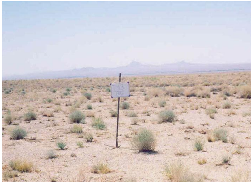
شکل 3: وضعیت پوشش عرصه در تیمار زمستانه، دو سال بعد از آتش‌سوزی (1385)