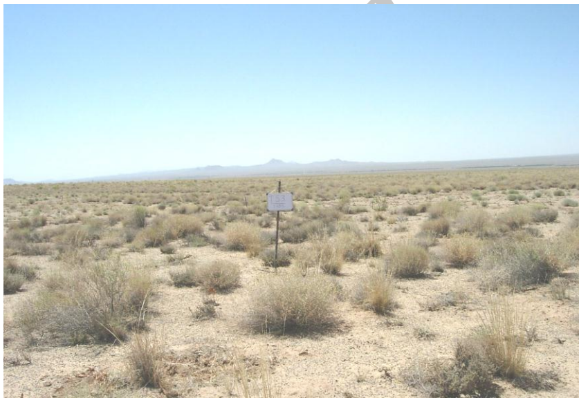
شکل 4: وضعیت پوشش عرصه تیمار شاهد، در سال 1385