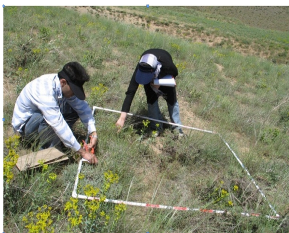
شکل ۲- پلات مورد استفاده در اندازه‌گیری پوشش گیاهی در حوزه زوجی گنبد

ویژگی‌های پوشش سطح خاک بر اساس اندازه‌گیری ۵۳ پلات در سطح زیرحوزه شاهد و نمونه به دست آمد. شاخص‌های آماری تمامی پارامترها نیز برای بررسی بهتر آنها محاسبه گردید که نتایج آنها در جدول (۱) برای زیرحوزه‌های مورد مطالعه آمده است.