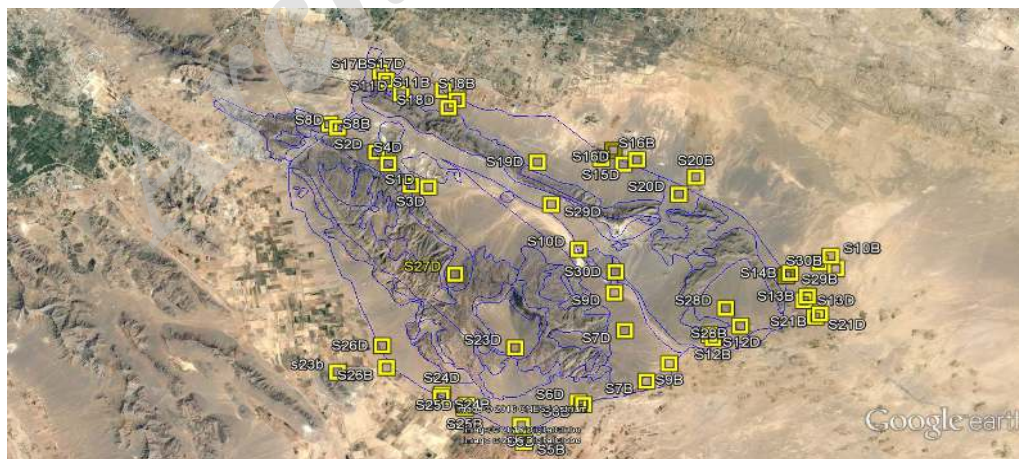
شکل ۱: نقشه موقعیت پارک کلاه قاضی و محل استقرار سایت ها و پلات ها

در مورد شاخص هایی که در متون علمی موجود نبوده و توسط کارشناسان یا بهره برداران معرفی گردیده است ضمن حضور در مرتع با همفکری خودشان در مورد نحوه ارزیابی شاخص تصمیم گیری شد. به استناد دستورالعمل ارزیابی مذکور، فرمی به منظور یادداشت برداری صحرائی تهیه گردید که در بالای این فرم مشخصات کلی محل