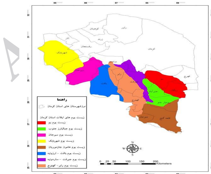
شکل ۱- نقشه زیست بوم‌های عشایر استان کرمان

بین روستاییان می‌گردد. طبیعتاً تولید بیشتر، افزایش بهره‌وری اقتصادی را برای روستاییان (و حتی شهرنشینان) در پی خواهد داشت. طبیعی لنگرودی و همکاران (۲۰۱۱) به بررسی نقش بازارهای دوره‌ای محلی در توسعه اقتصادی - اجتماعی روستاهای استان گیلان پرداختند. نتایج تحقیق آنها حاکی از آن است که بازارهای دوره‌ای محلی در ابعاد اقتصادی، اجتماعی و فرهنگی اثر مثبتی بر توسعه روستاهای مورد مطالعه استان گیلان داشته‌اند. دلیل این امر آن است که در بعد اقتصادی سه مؤلفه، در بعد اجتماعی و فرهنگی دو مؤلفه در بازارهای دوره‌ای وجود دارند که بر توسعه روستایی اثر گذارند و عامل توسعه اقتصادی و اجتماعی در نواحی روستایی مناطق مورد مطالعه می‌شوند. واقعیت آن است که برای ایجاد و دستیابی خانوارهای عشایری به یک معاش پایدار، می‌بایست در ابتدا وضعیت موجود مورد مطالعه و بررسی دقیق قرار گیرد و در این بررسی باید نقطه نظرات و دیدگاه‌های سرپرستان این خانوارها و کارشناسان لحاظ گردد. از سوی دیگر سازه‌هایی که قادرند در معیشت خانوارهای عشایری و در پایداری آن تأثیرگذار باشند، باید شناسایی و مورد مطالعه قرار گیرد. یکی از عواملی که می‌تواند به معیشت پایدار عشایر کمک شایانی کند تشکیل و توسعه بازارهای محلی جهت عرضه