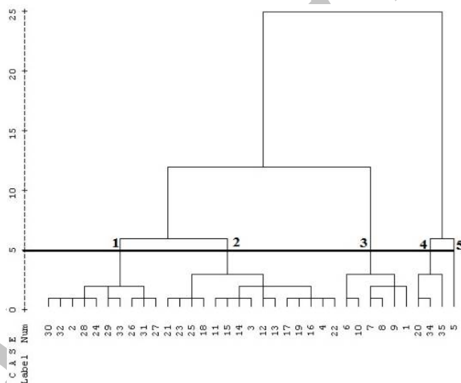
شکل ۳- گروه‌بندی مکان‌ها بر مبنای عوامل اکولوژیکی و تراکم گونه A. libanoticum با استفاده از روش تجزیه خوشه‌ای

* و ** به ترتیب معنی‌دار در سطح احتمال ۵ و ۱ درصد، ns عدم معنی‌داری اختلاف