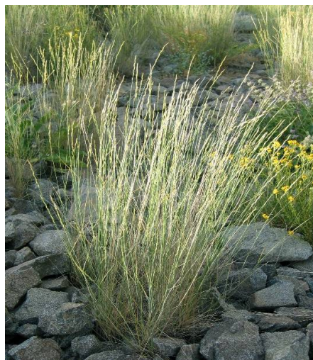
شکل ۲- گیاه Agropyron libanoticum

خوشخوراکی متوسط و طی مراحل رشد از میزان خوشخوراکی آن کاسته شده و کمتر مورد رغبت دام قرار می‌گیرد (۷، ۱۷ و ۲۰).