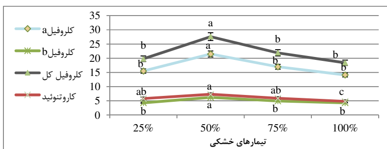
شکل ۲: تاثیر تیمارهای خشکی بر کلروفیل a، b، کلروفیل کل و کاروتنوئید بر حسب (میلی گرم بر گرم وزن تر)

همچنین از نظر غلظت کلروفیل a، b و کلروفیل کل، بین سطوح مختلف تیمارهای تنش اختلاف معنی‌داری وجود داشت (جدول ۳). نتایج نشان داد که کلروفیل a، b و کلروفیل کل تا سطح تیمار ۵۰ درصد ظرفیت زراعی (تنش متوسط) افزایش یافته و تفاوت معنی‌داری با شاهد داشتند به طوری که تیمار ۵۰ درصد (تنش متوسط) موجب افزایش میزان کلروفیل a، b و کلروفیل کل در رنگریزه‌های فتوسنتز در مقایسه با تیمار شاهد (۱۰۰ درصد ظرفیت زراعی) به میزان ۵۲/۵، ۴۴ و ۵۰ درصد شد، همچنین نسبت به تنش