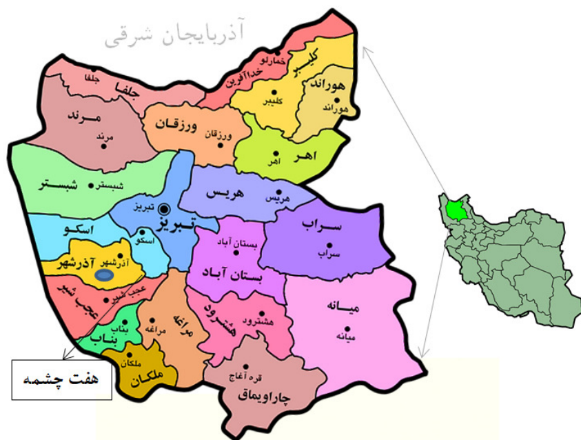
شکل ۱: موقعیت جغرافیایی منطقه مورد مطالعه در تقسیمات کشوری

۲۰ کیلومتری شهرستان آذرشهر در دهستان قبله داغی، بخش حومه، با ۱۷۵۵ نفر جمعیت با مختصات جغرافیایی " ۳۷°۳۸'۶۰" شمالی " ۳۵°۵۷'۴۵" شرقی مورد بررسی قرار گرفته که در این روستا از گذشته دامداری و کشاورزی شغل اصلی اهالی آن محسوب می‌شده. در این روستا بیشتر کارهای که به زمان و هزینه زیادی نیاز دارد با مشارکت اهالی روستا در قالب یک برنامه خاص که از گذشته به ارث مانده، در کمترین زمان ممکن و با هزینه مناسب انجام می‌پذیرد که یکی از آن‌ها نظام گله‌داری می‌باشد. روستای مذکور، خود از سه دسته بنام‌های دسته دیزج (دسته بالایی)، دسته میدان (دسته وسطی)، دسته قنبرآباد (دسته پایینی)، تشکیل شده است که همکاری و همیاری