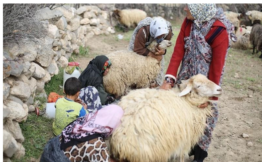
شکل ۲: سوتچیلر در حال انجام عمل شیر دوشی

گرفته می‌شود؛ که این قسمت (شیردوشی) در کشورهای پیشرفته به‌صورت مکانیزه انجام می‌شود تا زمان و نیروی کار کمتری صرف شود؛ که در منطقه مورد مطالعه نیز شاهد آن هستیم. "شیر پز" شخصی است که از اهالی روستا نیست ولی یک ماه از بهار و سه ماه تابستان برای خریداری شیر دام روستائیان به همراه نیروی کمکی خود با نرخ‌ی که با ریش سفیدان و سردسته‌ها به توافق رسیده به روستا می‌آید، شیر پز ممکن هر سال بنا به تصمیم روستائیان تغییر کند. شیر در همان محل مذکور به فرآورده که عمدتاً پنیر می‌باشد تبدیل شده و وارد بازار می‌شود.