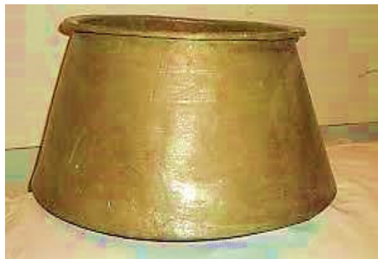
شکل ۴: قازانچا برای جمع‌شدن شیر دوشیده شده از دام

بعد از اتمام فصل تابستان و هنگام شروع فصل پاییز که مقدار شیر دام کاهش یافته و کیفیت آن نیز به خاطر خشک شدن علوفه تغییر کرده، شیر پز روستا معمولاً حساب خود را با اهالی صاف کرده و از روستا می‌رود تا اگر سال بعد هم با ریش سفیدان به توافق رسیدند، دوباره برای خریداری شیر به روستا برگردد؛ اما اگر اهالی روستا از او راضی نباشند، سران دست‌ها و ریش سفیدان، برای سال بعد با شیر پز دیگری مذاکره می‌کنند. در هنگام پاییز که شیر پز در روستا نیست، هر چند که مقدار شیر کاهش یافته ولی همه‌ی قوانین شیردوشی پابرجا بوده و بده بستان و عوض کردن شیر توسط شیر رفیق‌ها همچنان ادامه می‌یابد تا زمانی که دام‌های خشک شوند و دیگر شیری برای دوشیدن نداشته باشند. در این فصل زنان با سهم شیر خود برای اعضای خانواده پنیر و ماست و دیگر فرآورده‌های لبنی را درست می‌کنند. همچنین برخی از آن‌ها با قسمتی از سهم شیر خود، نوعی آش محلی درست کرده و در روستا پخش می‌کنند. این آش را در گویش محلی "سوتدی آش" ۳ می‌گویند که بسیار خوشمزه می‌باشد. برخی از زنان نیز با سهم شیر خود پنیر ساخته و مقداری را که خانواده نیاز دارد در ظروف مخصوص برای مصرف خانواده نگه می‌دارند و بقیه آن را فروخته و با پول آن برای خانواده اقلام ضروری دیگری را تأمین می‌کنند؛ و این چنین در زندگی خود در قالب گروه‌های سنتی با همکاری و همیاری متقابل بسیار دقیق و