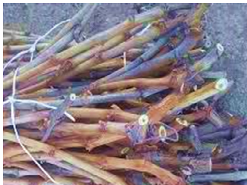
شکل ۵: شاخه‌های درخت تاک مورد استفاده برای ساخت "اولچی"