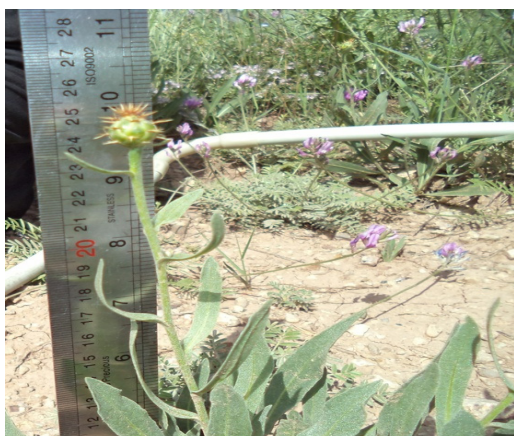
شکل ۲: نحوه اندازه‌گیری ارتفاع گیاه در منطقه مورد مطالعه

برای محاسبه سطح ویژه برگ ابتدا برگ‌های همه گونه گیاهی موجود در هر پلات جدا شدند. سپس برگ‌ها توسط دستگاه اسکن‌کننده، اسکن شدند و با نرم‌افزار Leaf area meter سطح آن‌ها بدست آمد (شکل ۳). سپس از نسبت سطح برگ به وزن خشک برگ، سطح ویژه برگ به دست آمد که واحد آن میلی‌متر مربع بر میلی‌گرم می‌باشد (۲۰).