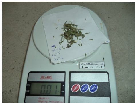
شکل ۴: اندازه‌گیری وزن برگ

برای تعیین ماده خشک برگ ابتدا نمونه‌های تر برگ برای هر گونه توزین شده (شکل ۴)، سپس داخل آون در دمای ۸۰ درجه سانتی‌گراد به مدت ۴۸ ساعت نگهداری شد تا کاملاً خشک شود. سپس درصد ماده خشک برگ برای گونه گیاهی به صورت نسبت وزن تر به ماده خشک برگ محاسبه گردید که واحد آن گرم بر میلی‌گرم می‌باشد (۱۸).