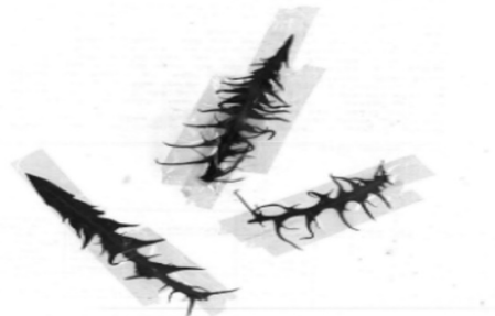
شکل ۳: اسکن سطح برگ

در شکل (۵) نتایج حاصل از آنالیز RLQ نشان داده شده است. در شکل a پلات پراکنش گونه‌ها، شکل b متغیرهای محیطی و شکل c ویژگی‌های کارکردی گیاهان را نشان داده است. نتایج جدول ۲ حاکی از آن است که ارتباط بین ویژگی‌ها و متغیرهای محیطی معنی‌دار بود. ارتباط به وسیله محور اول RLQ خلاصه شد که به میزان ۸۶/۶۴ درصد مجموع واریانس بین متغیرهای محیطی و ویژگی‌ها را نشان داد، در حالی که محورهای دیگر این مقدار کمتر بود. لازم به ذکر است مقادیر مشخص به صورت پررنگ در جدول نشان داده شدند. اولین محور RLQ، ۸۴ درصد تغییرپذیری محیطی و ۸۷ درصد واریانس ویژگی‌ها را نشان داد. در مجموع ۰/۶۲ همبستگی در طول محورهای RLQ داشتند که ۷۱ درصد تغییرپذیری محیطی را نشان دادند (جدول ۳).