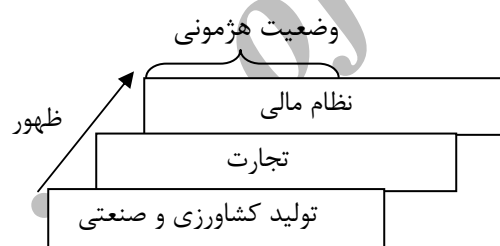
نمودار شماره ۱: ظهور هژمونی از نظر والرشتاین

۱. برتری نسبی: یک بعد اساسی برای قدرت هژمون برتری نسبی آن در برابر سایر بازیگران بین‌المللی است. این برتری باید در عرصه‌های اقتصادی، نظامی، فرهنگی، ایدئولوژیک، اجتماعی و سیاسی ملموس و مشخص باشد. والرشتاین به دو توانایی اقتصادی و داخلی اشاره می‌کند؛ در حوزه اقتصادی، تولید کشاورزی، صنعتی، تجارت و مالیه و در سطح داخلی، کارآمدی نظام سیاسی اهمیت ویژه‌ای دارند. (۳)