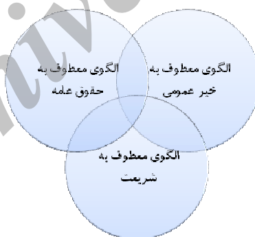
شکل ۲- مواجهه سه الگوی نظم سیاسی معطوف به خیر، حقوق عامه و شریعت

تلاش روشنفکران برای تحول در الگوی نظم هنجارین حاکم بر اجتماع سیاسی، باعث هویدا شدن تعارض آن با نظم سیاسی و هنجارین به میراث رسیده از عالم قدیم شد. در واکنش به این وضعیت است که شاهد مقاومت تصور فقهی و شرعی از نظم سیاسی در برابر این الگوی جدید هستیم. در نتیجه مواجهه عالم قدیم و جدید، شاهد تداخل سه الگوی متعارض با یکدیگر هستیم، که باعث پدیدار شدن الگوهای نظری فقهی نوسازی شده از یکسو و صراحت‌بخشی به الگوهای ضمنی موجود در اندیشه روشنفکران است.