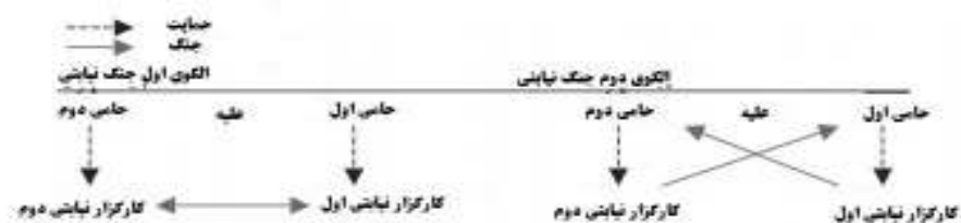
شکل ۱- الگوهای رایج جنگ نیابتی

است. هاینسچ در این باره به موضوع کنترل کلی ۱ در مقابل کنترل مؤثر ۲ اشاره دارد (Heinsch, 2015: 341-343).