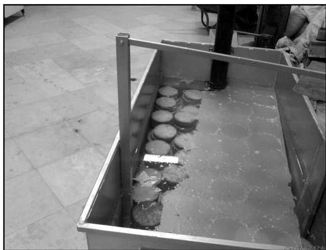
شکل ۱ - دستگاه مورد استفاده برای آزمایش

نمونه ی بتنی و تبدیل آن به چند بخش ادامه می یافت. برای استخراج رابطه و راست آزمایی آن از هر نوع آزمایش سه سری انجام شد، بنابراین با در نظر گرفتن ۵ عمق آب و سه عیار سیمان تعداد نمونه ها از هر نوع مخلوط ۴۵ عدد بود که بر روی هر نمونه تعدادی آزمایش ضربه تا شکست نمونه انجام شد.