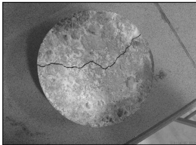
شکل ۲- نمونه‌ی بتنی هنگام قطع آزمایش ضربه

که در این رابطه F_D نیروی مقاوم، C_D ضریب شکل، A سطح مقطع سنگ و \rho جرم مخصوص آن می‌باشد. از تعادل دینامیکی نیروهای وزن، مقاوم و قانون دوم نیوتن پس از ساده کردن رابطه، می‌توان نوشت [۲]: