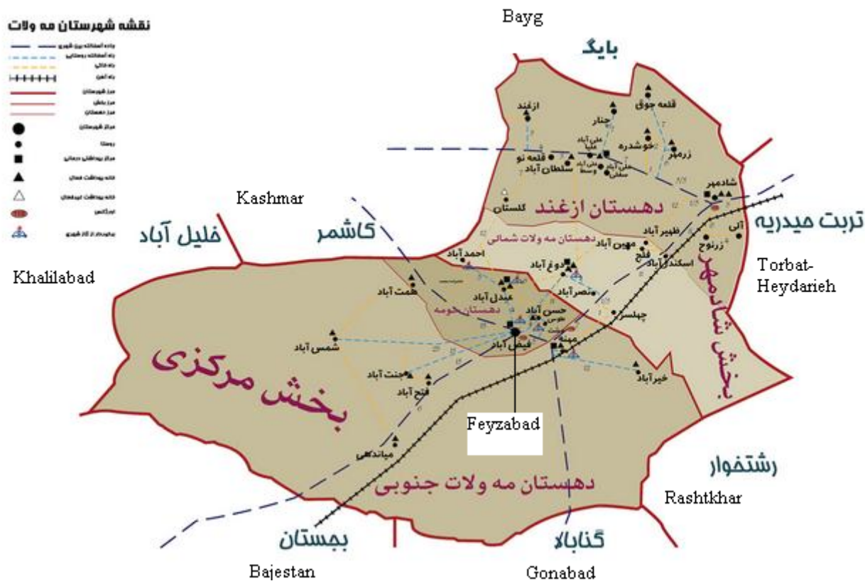
شکل ۱- موقعیت شهر فیض آباد مرکز شهرستان مه ولات در استان خراسان رضوی