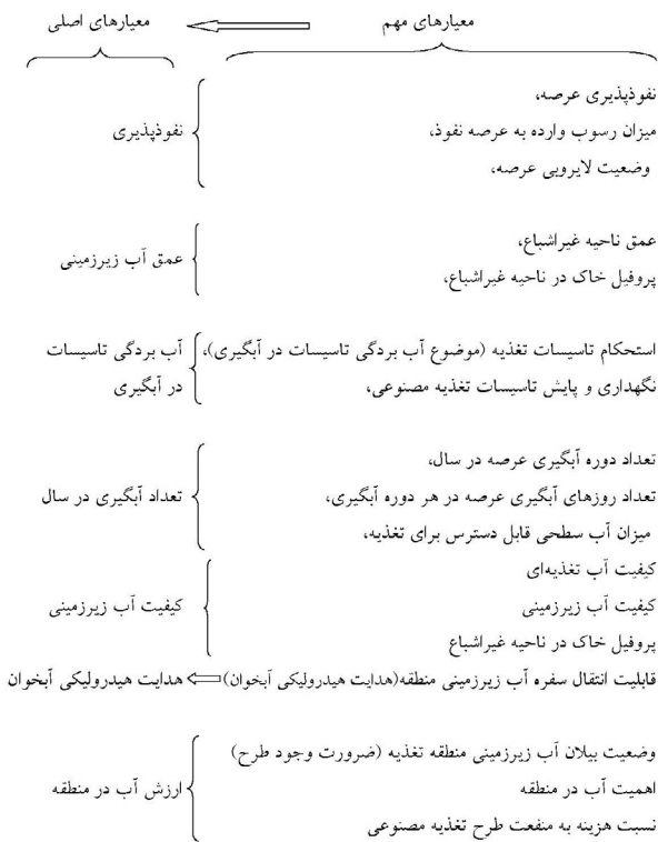
شکل ۳- گروه‌بندی معیارهای مهم و استقرایی معیارهایی اصلی Fig 3. Deductive final criteria by clustering important criteria

در بررسی اثر همسویی معیارهای مهم بعنوان مثال معیار مهم "میزان رسوب وارده به تاسیسات تغذیه" با وزن اهمیت ۵/۷۲ و نیز معیار مهم "وضعیت لایروبی عرصه" با وزن ۵/۳۱ که هر دو جزء معیارهای انتخابی بوده‌اند، میزان نفوذپذیری سطحی را تحت تاثیر قرار می‌دهند. بدین معنی که هر چه میزان رسوب وارده به تاسیسات تغذیه بیشتر باشد، باعث کاهش نفوذپذیری و از طرف دیگر هر چه عرصه تغذیه بطور منظم لایروبی گردد باعث افزایش نفوذپذیری سطحی خواهد شد. بنابراین طبق آنچه که در شکل ۳ ارائه شده است، معیار اصلی نفوذپذیری بعنوان معرف سه معیار مهم خواهد بود. همچنین در صورتی که پایش و نگهداری (شامل ترمیم و مرمت) تاسیسات پخش سیلاب و تغذیه مصنوعی به موقع صورت گیرد، منجر به استحکام بیشتر تاسیسات تغذیه خواهد شد و لذا در مواقع آبیگری، کمتر دچار تخریب و آب‌بردگی می‌گردند و برعکس. بدین معنی که معیار انتخابی استحکام تاسیسات تغذیه با وزن ۵/۷۶ در ارتباط با معیار وضعیت نگهداری و پایش طرح تغذیه با وزن ۵/۲۸ می‌باشد، لذا معیار اصلی "آب‌بردگی تاسیسات" موید این دو معیار مهم خواهد بود. به همین ترتیب، معیارهای انتخابی "وضعیت بیلان آب در منطقه" و معیار "نسبت هزینه به منفعت طرح" تحت تاثیر معیار اصلی "ارزش آب در منطقه" است. بدین معنی که هر چه ارزش آب در منطقه بالا باشد به تبع نسبت سود به هزینه طرح افزایش خواهد داشت. از طرف دیگر، اساساً ارزش آب در مناطقی بالاست که تقاضا برای آب زیاد است و این تقاضا بر بیلان آب زیرزمینی اثرگذار خواهد بود و اجرای طرح‌های تغذیه مصنوعی در دشت‌های با بیلان منفی حتی با هزینه اجرایی بالا، دارای توجیه اقتصادی خواهد بود. بنابراین معیار "ارزش آب در منطقه" بعنوان معیار اصلی انتخاب گردید.