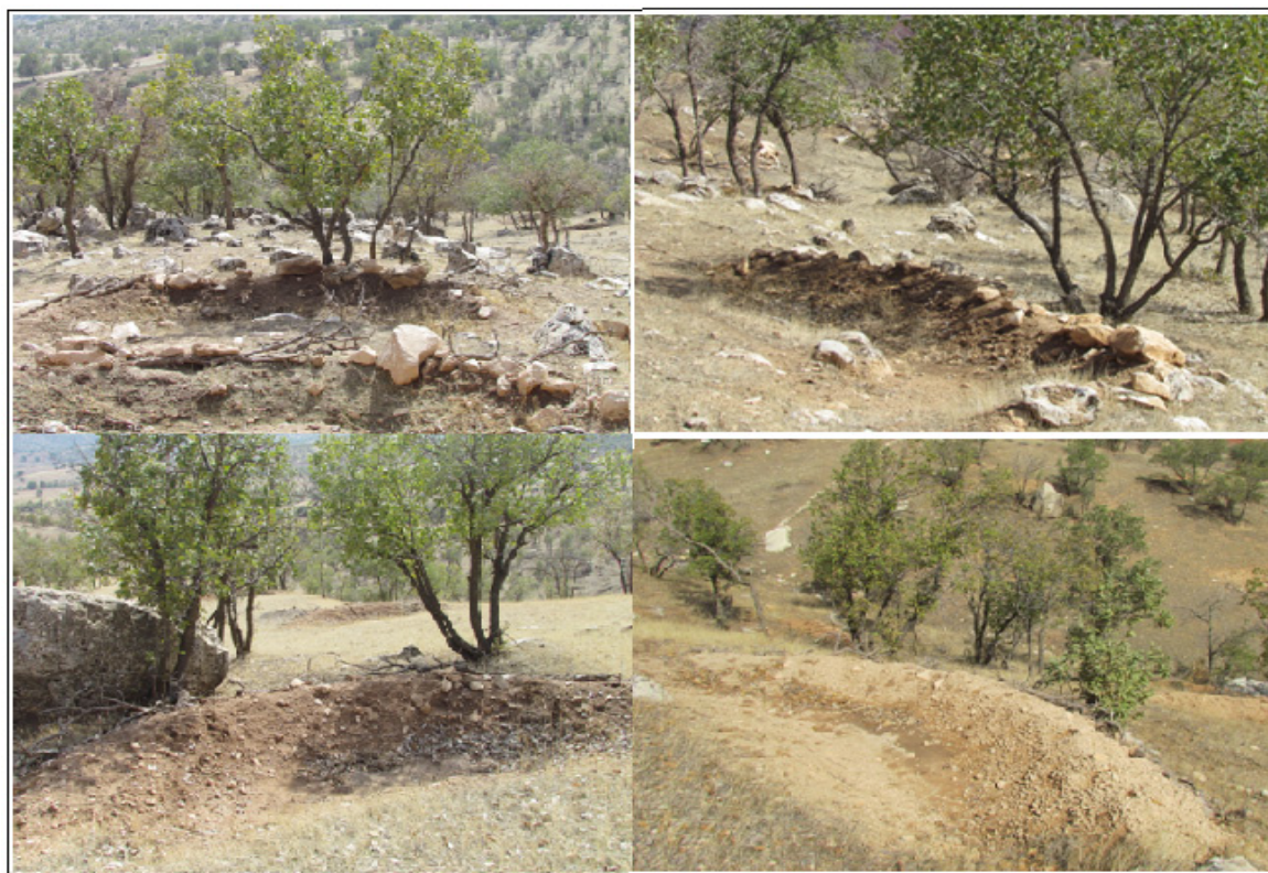
شکل ۳: بانکتها در سال سوم (آبان ۱۳۹۴)