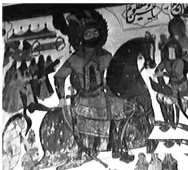
تصویر ۴. رفتن قمر بنی‌هاشم علمدار کربلا حضرت ابوالفضل العباس علیه السلام به سمت شریعه فرات برای آوردن آب. بقعه چهار پادشاه لاهیجان. عکاسی در سال ۱۳۸۵.