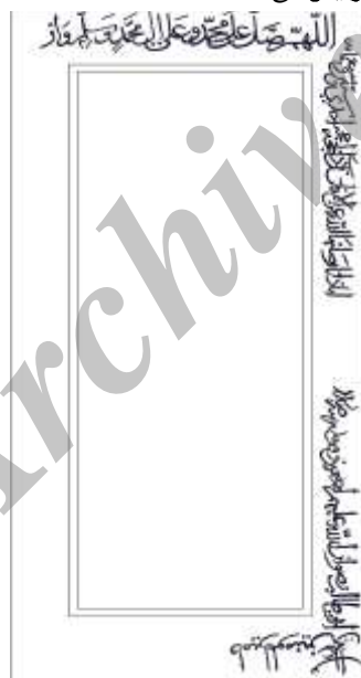
شکل ۲: کتیبه‌های داخل رحل موزه متروپولیتن (نگارنده)