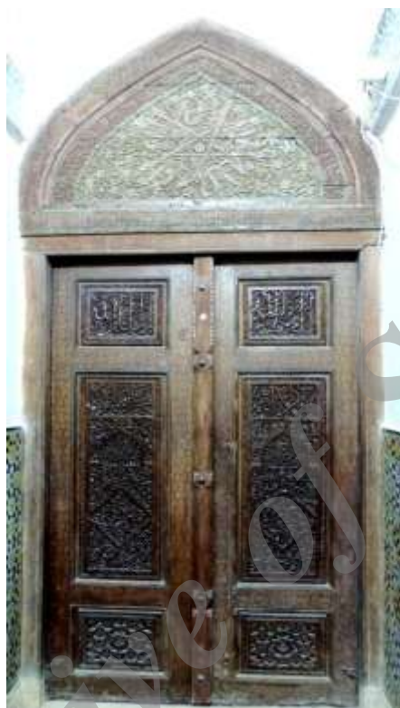
عکس ۵: میان در امامزاده اسماعیل علیه السلام (نگارنده)