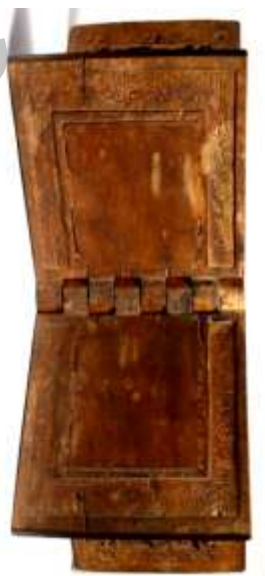
عکس ۷: کتیبه‌های داخل رحل موزه متروپولیتن (www.metmuseum.org)