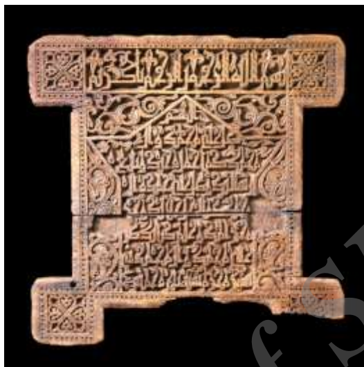
عکس ۳: لوح چوبی مجموعه دیوید (www.davidmus.dk)