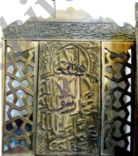
عکس ۲: کتیبه‌های تکیه‌گاه مسند حاوی شعار «لا اله الا الله محمد رسول الله عليا ولي الله حقا حقا» (قاسمی ۱۳۹۱)