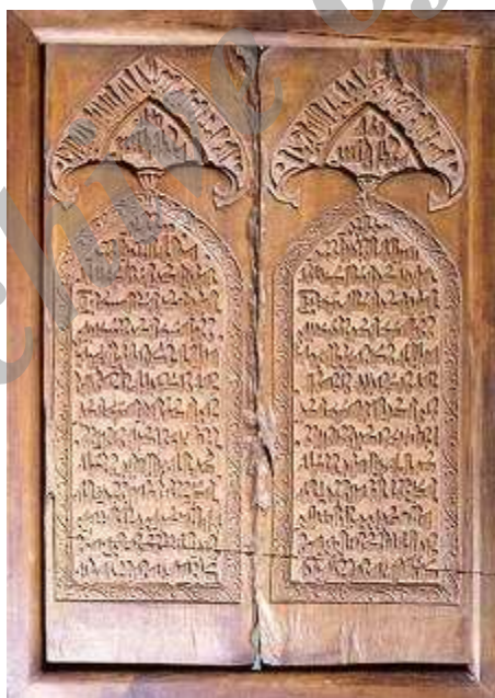
عکس ۴: پنجره چوبی موزه ملی ایران