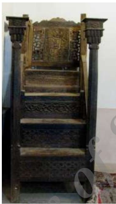
عکس ۱: نمای کلی منبر مسجد جامع ایبانه (قاسمی، ۱۳۹۱)