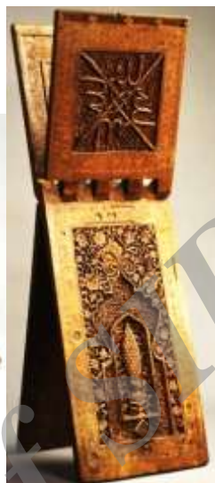
عکس ۶: نمای کلی رحل چوبی موزه متروپولیتن