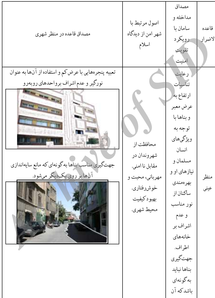
جدول شماره ۵: مصداق استفاده از قاعده لاضرار در منظر شهری معاصر با رویکرد تقویت امنیت