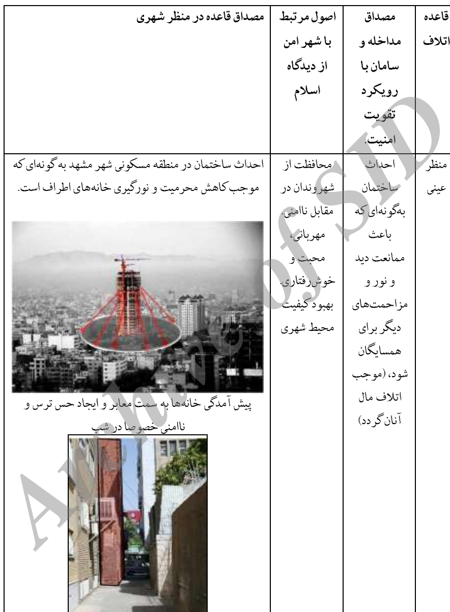
جدول شماره ۳: مصداق استفاده از قاعده اتلاف در منظر شهری معاصر با رویکرد تقویت امنیت