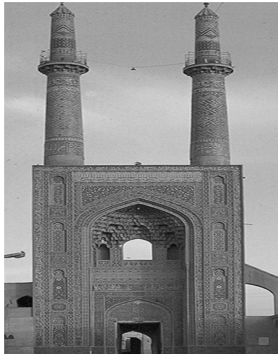
مسجد جامع یزد

بنای اصلی مسجد کنونی از آثار سیدرکن‌الدین است. بعد از آن‌که وی دید مسجد جامع قدیم رو به خرابی نهاده، به فکر افتاد تا مسجدی وسیع‌تر و بهتر در جوار آن بسازد و قسمتی از مسجد قدیم را بدان پیوست داد، نام بانی نخست را بر جای گذارد.