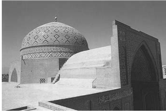
آرامگاه امیرنظام‌الدین واقع در مرکز یزد

این خانواده نام خویش را از نیایشان نظام‌الدین قوام‌الدین شرفشاه گرفته‌اند که رئیس یزد و بزرگ (نقیب) سادات شهر بود و خانقاهی در بیرون از باروی شهر تأسیس کرد که در پیرامون آن گورستان سادات پدید آمد.