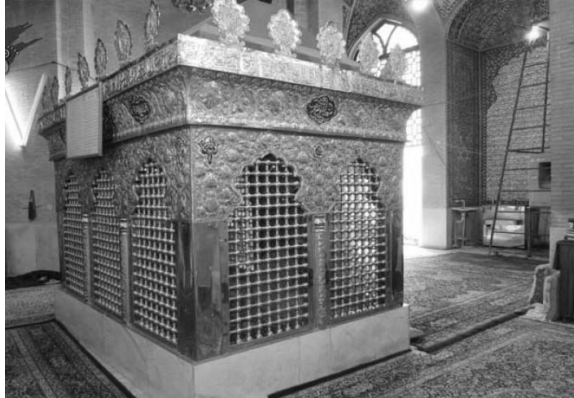
سیدتاج‌الدین واقع در محله فهادان یزد

ذکر مزار سیدتاج‌الدین جعفر داخل یزد در شهرستان ... و او از نزدیکان فرزندان محمدبن {علی بن} عبیدالله است و بسیاری کرامات از او ظاهر شده و گوشه انزوا داشتی و روزهای جمعه از خانه بیرون نیامدی و به مسجد رفتی و دیگر از خانه بیرون نیامدی و هیچ‌کس بر حال او اطلاع نداشتی و در مقام عبادتگاه او مدفون است. وفات او در سال ستمائه بود. (جعفری، ۱۳۸۴، ص ۱۲۹-۱۳۰)