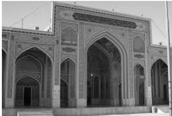
امامزاده جعفر واقع در بلوار امامزاده یزد

ساختن عمارت بسی مشعوف و به رفاه حال مسلمین راغب بود. در محله کوچه حسینیان منزلی به تکلف ترتیب داده در آن جا می‌بود و مسجد جامع سرریگ و مسجد جامع سرآب نو مشهور به محله شیخ‌دادا از آثار اوست و املاک و رقباتی که بر آن‌ها و سایر بقاع وقف نموده، بسیار و بی‌شمار است. اکنون به جز نامی نمانده و چون آن جناب موافقت قدما نموده سفر عقبی اختیار نمود، حسب الوصیت در گنبد مدرسه کوچه حسینیان که از آثار والد بزرگوارش بود مدفون گشت ... (جعفری، ۱۳۸۴، ص ۲۳۴-۲۳۵)