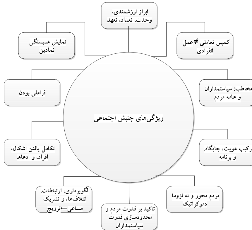
نمودار شماره ۱: ویژگی‌های جنبش اجتماعی

هر جنبش اجتماعی باید به نوعی ویژگی‌های ارزشمندی، وحدت، تعداد، و تعهد را نشان دهد. این ویژگی‌ها تعیین یافتن یک تظاهرات موفق و البته تأثیرگذار را مشخص می‌کند (تیلی، ۱۳۹۴: ۳۳۱). باید توجه داشت که ابراز این چهار ویژگی از اهمیت فراوانی برخوردار است زیرا حامل پیام‌های مهم سیاسی است و با دیگر ویژگی‌های خاص جنبش‌های اجتماعی همچون مشارکت‌جویان، بیانیه‌ها، مصاحبه‌های مطبوعاتی، جزوه‌ها، بستن روبانی با رنگ خاص و یا پوشیدن لباس‌های هم‌رنگ و هم‌سان، به‌کارگیری نمادها و نشان‌های خاص، اهتزاز پرچم، و یا حتی حضور ساده در جمعیت مرتبط است (polletta, 2002: 65). ابراز این چهار ویژگی ارتباط مستقیم با یکی دیگر از ویژگی‌های جنبش‌های اجتماعی دارد: ادعاهای مرتبط با هویت، جایگاه، و برنامه.