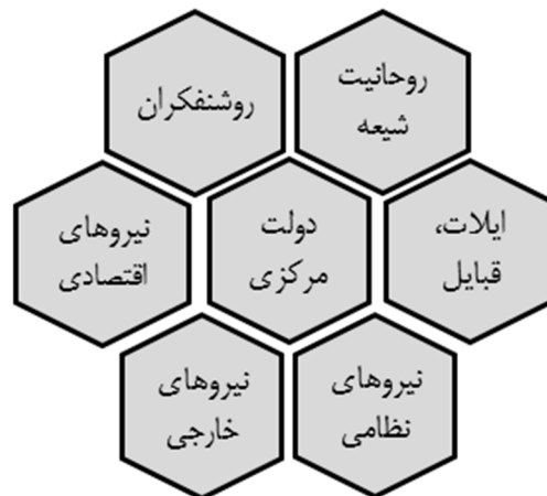
شکل ۱. پراکندگی منابع قدرت اجتماعی و روابط موازی میان آنها

تاکنون پراکندگی منابع قدرت اجتماعی داخلی و خارجی مورد بررسی قرار گرفت. منابع قدرت در جامعه ایران دوره قاجار به‌صورت موازی و شناور در کنار همدیگر قرار داشتند که فضای خالی میان خانه‌های شکل (۲) حاکی از همین نکته است. موازی و شناور به این معنی که هر لحظه این امکان وجود داشت که در اثر تحول روابط نیروهای اجتماعی، دولت با چالش و بحران‌های بیشتری مواجه شود یا در وضعیت بهتری قرار گیرد. در ادامه با معرفی ساختار دولت در مانده که برآمده از روابط نیروهای اجتماعی است، نهایتاً مدل تئوریک ساختار دولت و روابط خارجی در دوره قاجار ارائه خواهد شد.