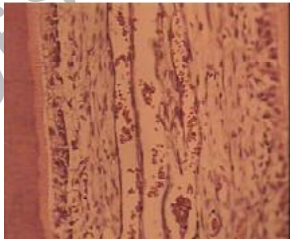
تصویر ۲: نمای میکروسکوپی پالپ دندان شیری سگ با بزرگ‌نمایی ۴۰ به روش رنگ آمیزی H&E