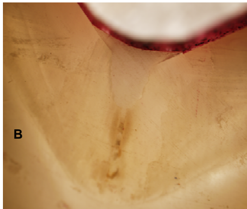
شکل ۱. میزان نفوذ رنگ بین دندان و سیلانت

A. نفوذ رنگ بیش از \frac{2}{3} عمق شیبار (درجه ۳).