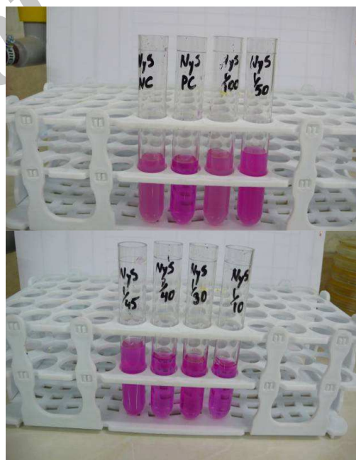
شکل ۲. نتایج تأثیر نیستاتین در رقت‌های مختلف بر لوله‌های آزمایش حاوی کاندیدا آلبیکانس و لوله‌های آزمایش کنترل