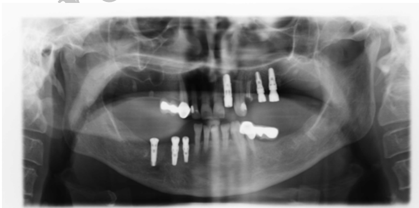
شکل ۱. ریشه‌های باقی‌مانده‌ی متعدد، پوسیدگی دندان‌ها، ضایعه‌ی پری‌اپیکال در دندان پرمولر اول فک بالا دقیقاً مجاور ایمپلنت مشاهده می‌شود

با وجود آگاهی دندان‌پزشکان از توالی صحیح طرح درمان، به دلیل استقبال فراوان دندان‌پزشکان و بیماران از درمان‌های ایمپلنت، بیم آن می‌رود که در مواردی توالی طرح درمان به درستی رعایت نشده و قبل از انجام سایر درمان‌های مورد نیاز بیمار که مقدم بر درمان ایمپلنت هستند، جراحی‌های ایمپلنت صورت گرفته و سبب شکست درمان و مشکلات متعاقب آن گردد. بنابراین هدف از این مطالعه بررسی رادیوگرافی‌های پانورامیک جهت تعیین خطاهای صورت‌گرفته در حین درمان و انتخاب محل کاشت ایمپلنت در بیماران دارای فیکسچر ایمپلنت (مرحله‌ی Post surgical) مراجعه‌کننده به بخش رادیولوژی