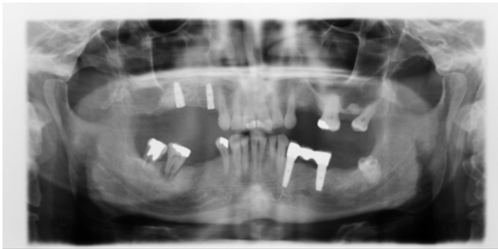
شکل ۲. پوسیدگی دندان، ضایعه‌ی پری‌اپیکال در دندان مولر فک پایین مشاهده می‌شود

هرگرافی یک بار بررسی شد. برای اطمینان از عدم ایجاد پوسیدگی پس از قرار دادن فیکسچر، فاصله‌ی بین قرار دادن فیکسچر و تهیه‌ی رادیوگرافی بسیار کوتاه (حداکثر ۳ ماه) تعیین شد. همچنین تنها پوسیدگی‌های Moderate تا Severe ثبت گردید و از پوسیدگی‌های Incipient صرف‌نظر شد. همچنین به‌عنوان هدف فرعی محل جای‌گذاری ایمپلنت از نظر ارتباط ایمپلنت با ساختارهای مجاور آن بررسی گردید. برای تعیین دقت در قراردعی ایمپلنت‌ها از فاصله‌های موجود در جدول ۱ استفاده گردید.