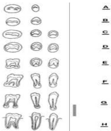
شکل ۱: مراحل هشت‌گانه‌ی کلسیفیکاسیون دندان طبق روش دمرجیان و همکاران (۱۰)

مورفولوژی مهره‌های گردنی در سفالومتری‌ها با بررسی چشمی و با استفاده از اطلس ارزیابی شد. دو مجموعه‌ی متغیر، مورد ارزیابی قرار گرفت: ۱- تقعر در بوردر تحتانی تنه‌ی مهره‌های C2، C3 و C4 و ۲- شکل تنه‌ی مهره‌ی C3 و C4 که به صورت ذوزنقه‌ای، مستطیل افقی، مربع، مستطیل عمودی باشند (روش بلوغ مهره‌های گردنی CVM (Cervical vertebral maturation) طبق روش باسیتی و همکاران (۱۱)) (جدول ۱ و شکل ۲).