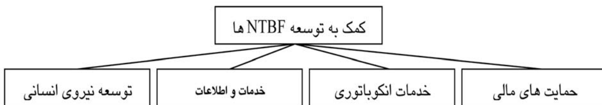
شکل ۱- دسته بندی ابزارهای سیاستی حمایت از NTBFها

حاصل مرحله قبل اختصاص یک عدد فازی به هر ابزار سیاستی است؛ در نتیجه، برای این که این ابزارها قابل مقایسه و اولویت بندی باشند، باید اعداد فازی مذکور غیر فازی شوند.