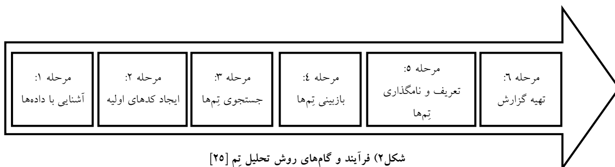
شکل ۲) فرآیند و گام‌های روش تحلیل تم [۲۵]

فاصله زمانی و مشخص، دو بار کدگذاری می‌شوند. سپس کدهای مشخص‌شده در دو فاصله زمانی برای هرکدام از مصاحبه با یکدیگر مقایسه و برای هر مصاحبه کدهایی که در دو فاصله زمانی مشابه بوده‌اند با عنوان «توافق» و کدهای غیرمشابه با عنوان «عدم توافق» مشخص می‌گردند. نهایتاً محاسبه پایایی بین کدگذاری‌های انجام‌گرفته بر مبنای فرمول