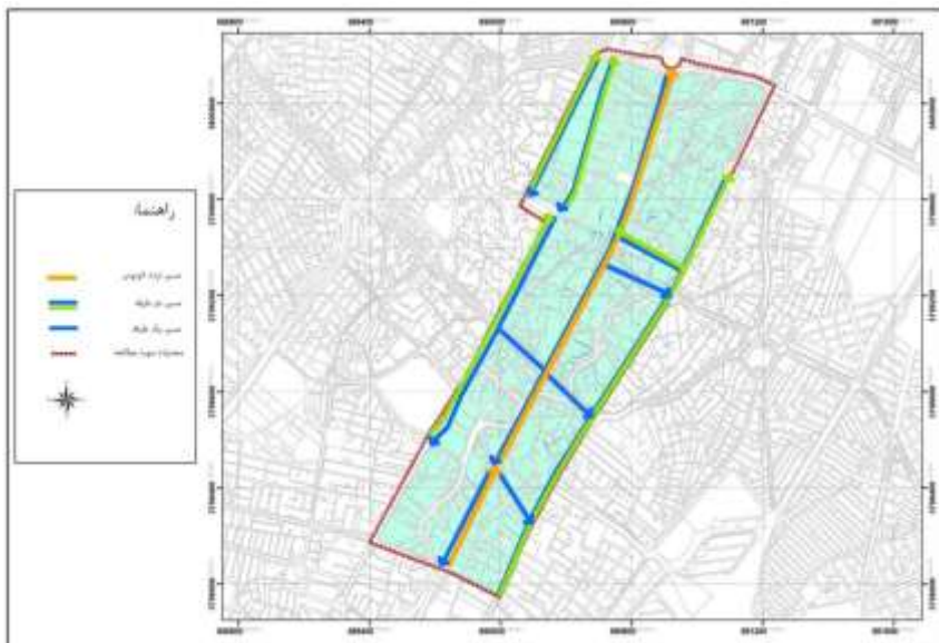
نقشه ۲. سیاست‌های ترافیکی اعمال شده در محدوده طرح ترافیک شهر کرمانشاه