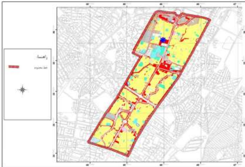
نقشه ۱. محدوده طرح ترافیک شهر کرمانشاه

گرفته‌اند عبارت‌اند از: ۱- بنت الهدی، ۲- مدرس، ۳- شریعتی، ۴- بلوار مطهری، ۵- نواب صفوی، ۶- معلم، ۷- دارایی، ۸- شهید مدنی، ۹- بلوار افشار توس، ۱۰- گمرک، ۱۱- کاشانی امجدیان، ۱۲- کارگر، ۱۳- بلوار جوانشیر و ۱۴- جلیلی. نقشه ۱ موقعیت محدوده طرح ترافیک شهر کرمانشاه و خیابان‌های موجود در این بخش از شهر را نشان می‌دهد.