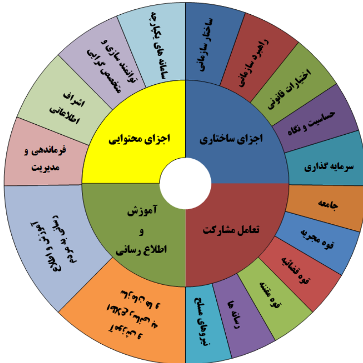
شکل ۲: الگوی مفهومی پیشگیری از شکل‌گیری باندهای قاچاق کالا توسط پلیس