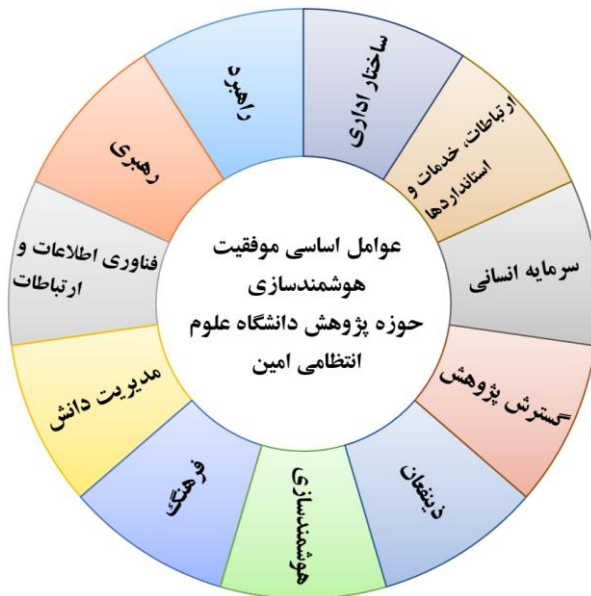
شکل ۱- الگوی عوامل اساسی موفقیت حوزه پژوهش دانشگاه

نظام‌مند و همچنین احصاء نظرات خبرگان و مقایسه آن با ادبیات پژوهش، عوامل اساسی موفقیت و شاخص‌ها آن بر اساس ۱۱ بعد اصلی در جدول نشان داده شده است. یکی از گام‌های پایه در روش CMMI تعریف اهداف کسب و کار و CSF ها در سطوح بلوغ می‌باشد. فرآیندها بر پایه CSF ها تدوین و در ادامه مورد ارزیابی قرار می‌گیرند (کنت و بیکر ۱ ، ۲۰۱۰). الگوی عوامل اساسی موفقیت حوزه پژوهش دانشگاه در شکل ۱. نشان داده شده است.