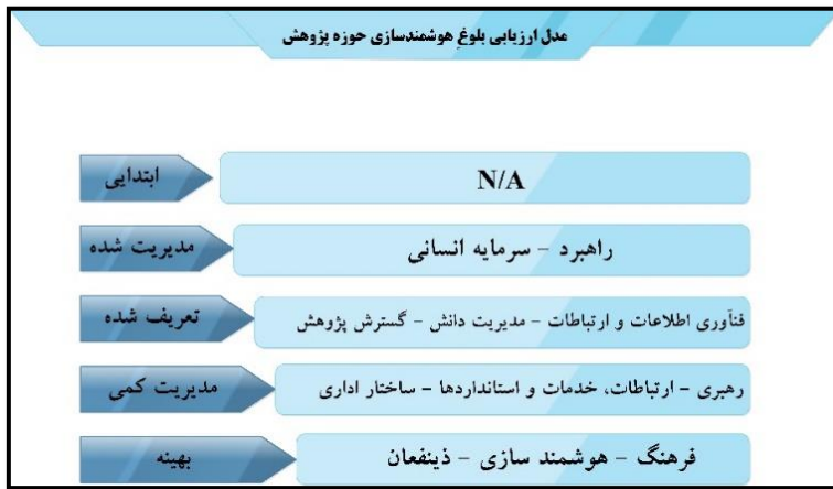
شکل ۲- مدل ارزیابی بلوغ هوشمندسازی حوزه پژوهش

با توجه به نتایج به دست آمده از مراحل ۱ و ۲ و همچنین تصدیق نتایج و اعتبارسنجی آن از طریق مقایسه نتایج به دست آمده در دو مرحله مذکور، مدل بلوغ هوشمندسازی حوزه پژوهش بر اساس عوامل اساسی موفقیت استخراج شده و در شکل (۲) نشان داده شده است.