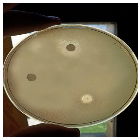
شکل ۳. اثر ضد میکروبی فیلم زیست‌فعال استات سلولز دارای فاژ لیتیک اختصاصی / شرشیا علیه باکتری / شرشیا

پس از قراردادن فیلم اصلاح‌شده با تیمار پلاسما در سوسپانسیون از فاژ با غلظت 10^{10} PFU/ml، به میزان 10^8 PFU/ml از ذرات فاژ بر سطح آن تثبیت شد. انتشار فازها از سطح فیلم طی ۱۴ روز اندازه‌گیری شد که نتایج آن در شکل ۴ آورده شده است. همان‌طور که از شکل ۵ مشاهده می‌شود، پس از گذشت ۱۱ روز از زمان تثبیت فازها بر سطح فیلم، میزان فازهای تثبیت‌شده از 10^8 به 10^6 کاهش یافت. دلیل این امر می‌تواند وجود اتصالات ضعیف میان برخی از فازها با سطح پلیمر باشد که در اثر قرارگیری روزانه در محلول بافری به‌مدت ۱۱ روز، به درون محلول منتشر شده‌اند. همچنین پس از روز ۱۱ تا پایان روز ۱۴ کاهش در میزان فازهای تثبیت‌شده مشاهده نشد که بیانگر ایجاد اتصالات قوی میان بسیاری از فازها با سطح پلیمر بوده است. همان‌طور که گفته شد،