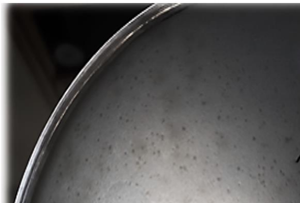
شکل ۱. باکتری های اشرشیا لیز شده و پلاک های ایجاد شده از طریق فاژ با استفاده از روش آگار دولایه

فاژ اختصاصی باکتری اشرشیا ، در محیط کشت LB حاوی باکتری اشرشیا پلاک های واضحی تشکیل دادند که از طریق نقاط لیز شده و حفرات تشکیل شده در سطح محیط کشت به وضوح قابل رؤیت شدند (شکل ۱). تعداد فاژهای موجود در محلول نیز با استفاده از رابطه ۱ محاسبه شده و 10^{10} PFU/ml تخمین زده شد.