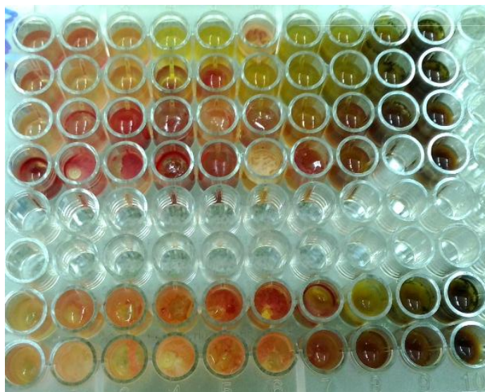
شکل شماره ۱: تعیین حداقل غلظت مهارکنندگی از رشد اسانس ترخون، با استفاده از پلیت ۹۶ خانه‌ای و معرف تری فنیل تترازولیوم.

تشکیل نگردید، به عنوان MIC گزارش شد (۱۱، ۱۲).