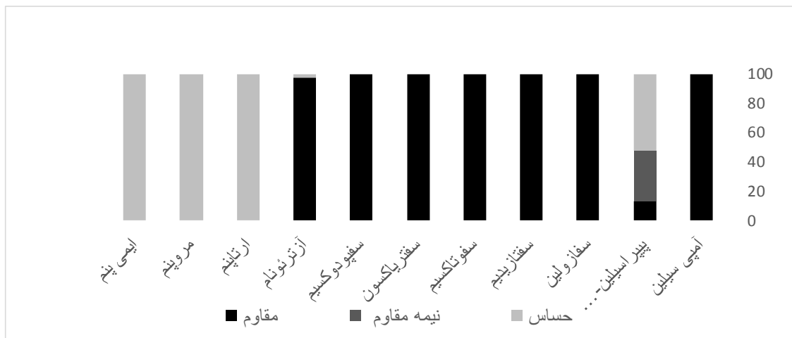
نمودار شماره ۲: درصد مقاومت ایزوله‌های مثبت ESBL K. Pneumoniae

ایزوله‌های بیماران بستری در ICU و بخش سوختگی، بیشترین تعداد تولید ESBL را داشتند (جدول شماره ۲). میزان مقاومت به اکثر آنتی‌بیوتیک‌ها (بجز آمپی‌سیلین و کاربامپنم‌ها)، به‌طور معنی‌داری ( p=0/001 ) در جدایه‌های مولد ESBL بیشتر از جدایه‌های فاقد ESBL بود.